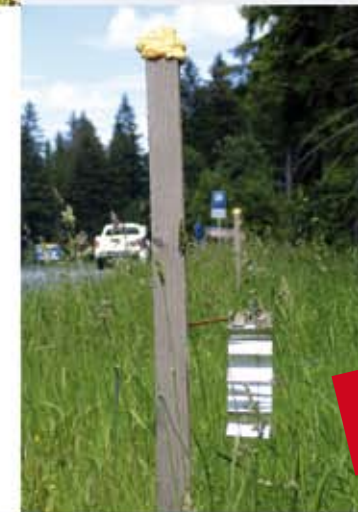
Die Kombination aus Reflektoren und Duftzäunen bringt zusätzlichen Schutz – aber noch keine vollkommene Sicherheit.

Auf diesen Streckenabschnitten stehen besondere Hinweisschilder, Dreibeine, Duftzäune und Reflektoren.