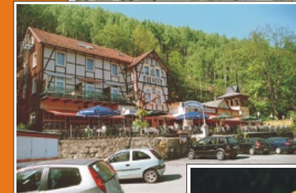
Flyer made by sehenswert.de