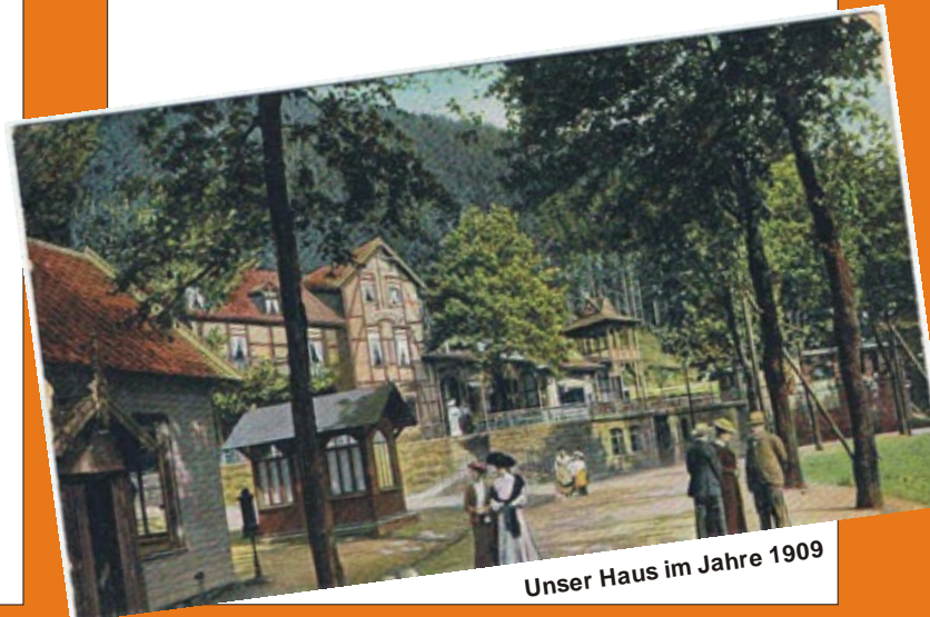
Unser Haus im Jahre 1909